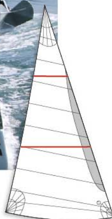
GÉNOIS SUR ENROULEUR